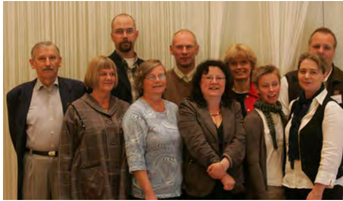
Delar av den nya huvudstyrelsen och kansliet