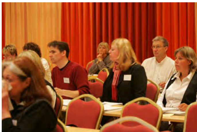
Vad händer nu då?